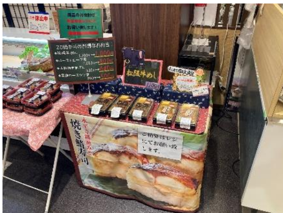
岡崎SA（集約）…20時から特別メニューを販売