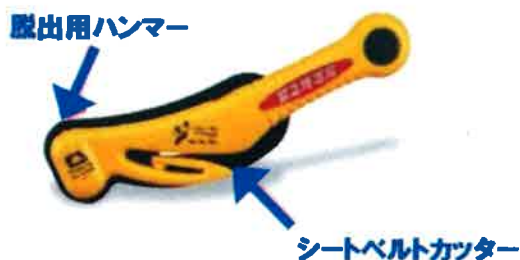
脱出用ハンマー、シートベルトカッターの例