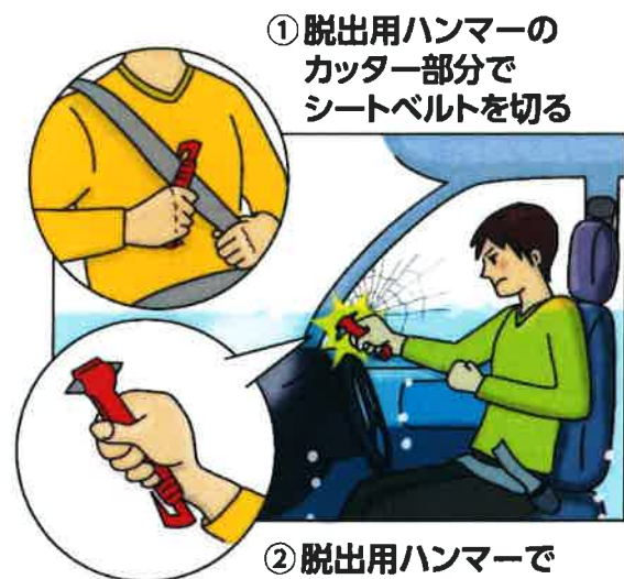
脱出用ハンマー、シートベルトカッターの使い方 (JAF ホームページより)